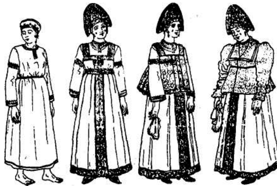
Рис.12 Рис.13 Рис.14 Рис.15

В северный женский костюм входили: нижняя и «красная» рубахи, повойник (рис. 12), сарафан (рис. 13), душегрея (рис. 14) — короткая распашная одежда на лямках, иногда ее заменял шугай (рис. 15) — одежда типа кофты.